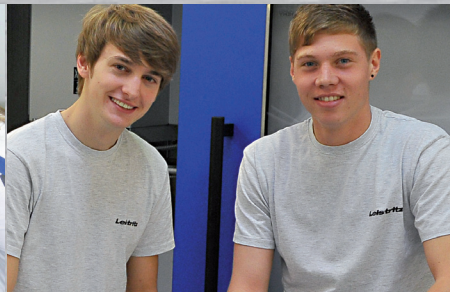
Auszubildende bei Leistritz