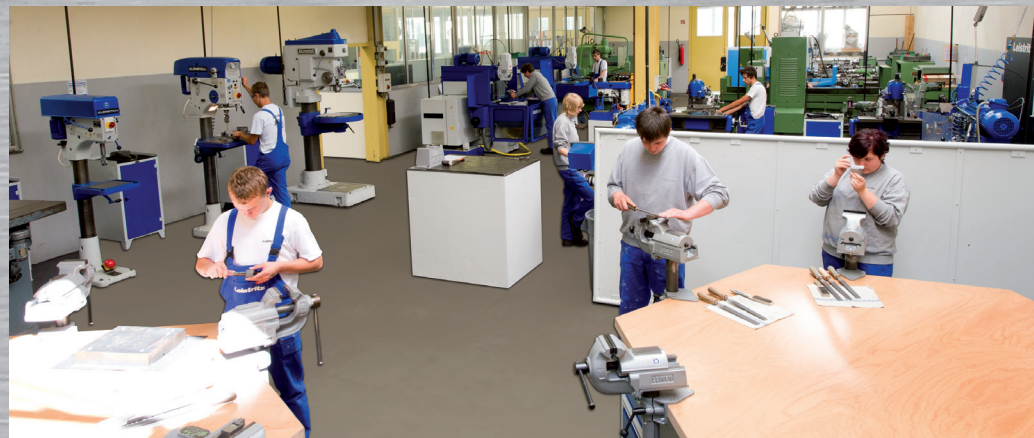
Lehrwerkstatt in Pleystein

Nach erfolgreichem Abschluss Ihrer Ausbildung können Sie bei uns sofort Ihre Zukunft starten.